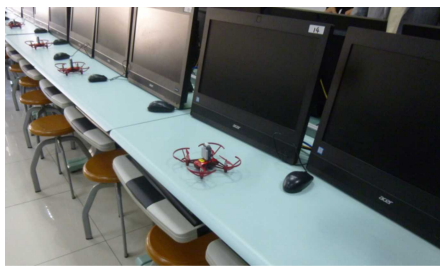
ドローンを使った授業も

*素質教育とは、従来の受験競争から脱皮し、生徒の持つ固有の能力と個別の学習速度に応じた多様な形態の教育をいう。これを判断基準としてモデル校の認定が行われます。