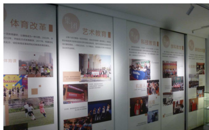
教育改革を示す5つの特色