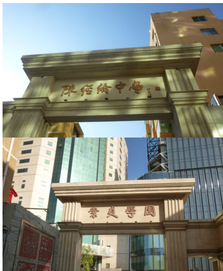
正門の表裏に2つの校名を示す

モデル校として教育改革にも熱心に取り組んでおり、実験室やテレビ放送局など施設も充実しています。