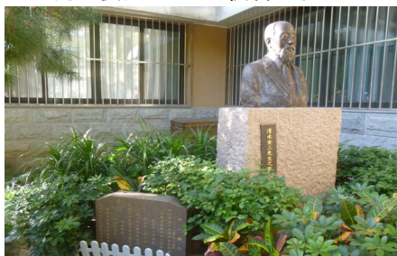
清水安三先生の胸像